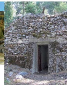
Ouvrage militaire de la Lame