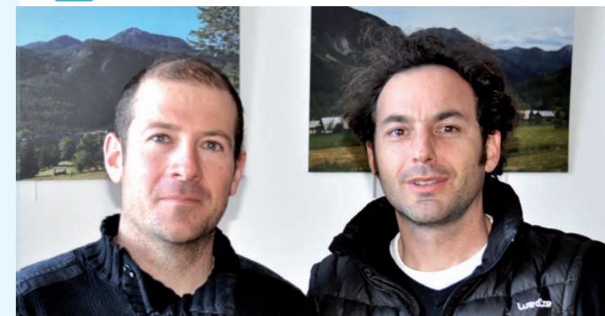
Une partie de l'équipe

Devant la montée de la précarité liée à la crise économique que nous traversons depuis plusieurs années, et des difficultés ressenties par une partie de la population, la Communauté de Communes a décidé de s'impliquer en mettant en place un dispositif de solidarité comprenant des infrastructures et des moyens humains de qualité.