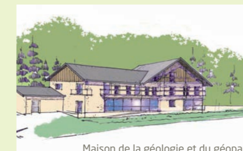
Maison de la géologie et du géoparc

Le PER rassemblera de nombreux partenaires : l'Université Joseph-Fourier de Grenoble, le CNRS, le Parc National des Écrins, le Conseil Général des Hautes-Alpes, les Conseils Régionaux de Rhône Alpes et de Provence-Alpes Côte d'Azur. Pour mener à bien ces deux projets, la Communauté de Communes du Briançonnais a sollicité l'aide financière du Conseil Général 05, de la Région, de l'État, de l'Europe et de l'ADEME.