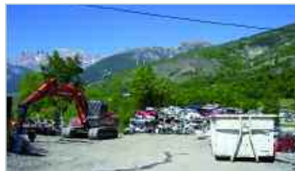
Ancien site au Centre d'Activités Sud

L'aménagement pour l'instant provisoire, ainsi réalisé, représente un investissement de 74 800 € TTC, que la Communauté de Communes souhaite pérenniser en mettant en œuvre tous les moyens, pour obtenir l'autorisation de faire du site du Pilon le lieu définitif d'implantation de l'activité et ainsi abandonner le site des « Gipières » situé à Malefosse, ultime recours.