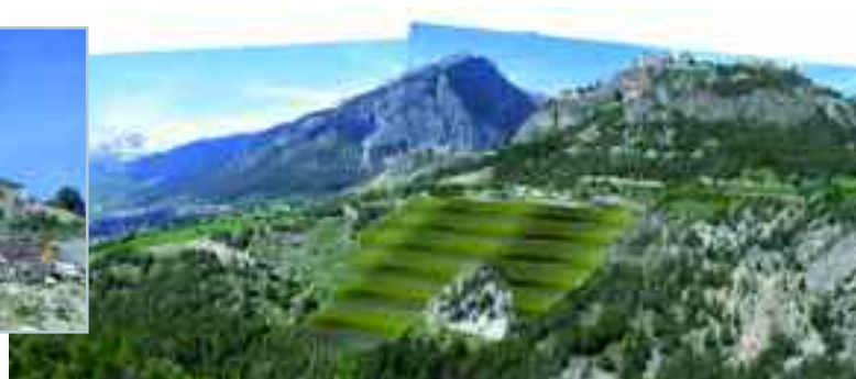
Avant et après le traitement paysager