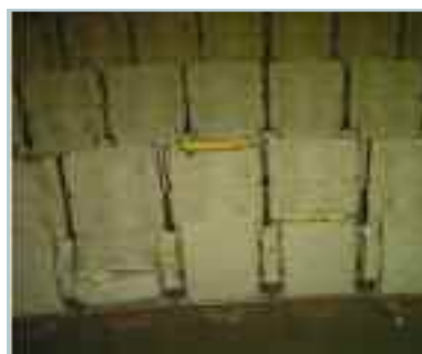
Avant et après

Le Conseil Communautaire a voté en octobre dernier la rénovation des sièges de la salle de spectacles du Cadran. Celle-ci a consisté en un réhousage des fauteuils pour un montant de 38 865 € TTC . Cette opération permet la sécurité et le rajeunissement des lieux. Le treuil manuel permettant de déplacer les lumières a également été remplacé pour 5 321 € TTC.