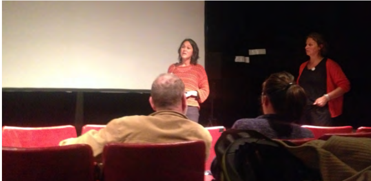
Avril 2019 : Déplacer les montagnes présenté à l'Eden Studio

AR Prefecture 005-24050-439-20201120-D2020_134-DE Reçu le 26/11/2020 Publié le 26/11/2020