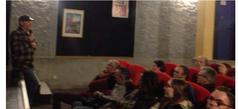
Décembre 2019 : série d'avant première et de rencontre pour le réalisateur Jean Michel Bertrand et son nouveau film MARCHÉ AVEC LES LOUPS